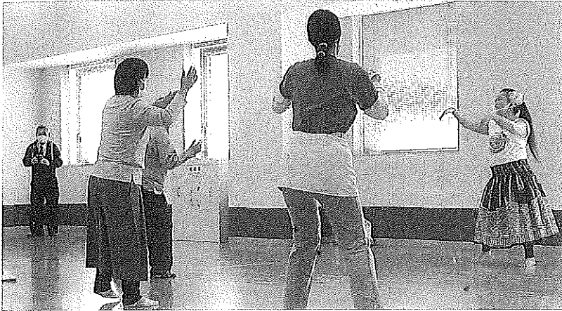
令和2年10月25日(日) つるの会「フラダンス講習会」