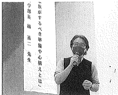
令和2年11月24日(火) 親なき後を考える講演会

人の意向に添ったグループホームを建設する方法もあること、軽度障害者についてネット依存が問題となっていること、個別支援計画について具体的な目標を立て見直していくことが必要であることなどを講義いただきました。